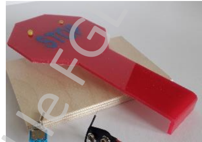
Comhartha Stop Aicrileach

Sa tasc seo, iarrtar ar an scoláire a chuid eolais a chur i bhfeidhm ón dá ghníomhaíocht roimhe seo. Anseo úsáidimid comhartha stop aicrileach chun an tasc seicheamhaithe seo a dhéanamh. De rogha air sin, d'fhéadfá rud den chineál céanna a úsáid ó do sheomra ranga féin